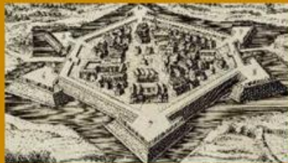
A végvárak feladata

A végvárak az oszmán hódítás elleni magyar védelmi rendszer alapvető egységei voltak. A középkorban az ország déli határvezetében, majd a török uralom időszakában a Hódoltság peremén alkották többé-kevésbé egybefüggő védővonalat. Ezzel a védővonallal szemben a török oldalon is lépett az erődírmények rendszere, melyek szerepe nagyjából megegyezett a magyar várakkal.